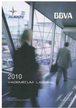
Vademécum Laboral 2010