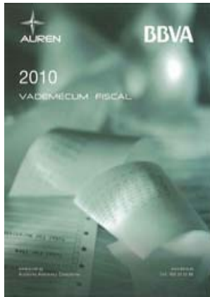
Vademécum Fiscal 2010