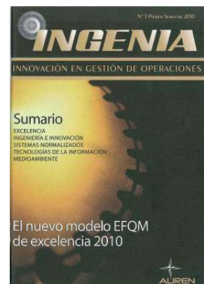
Revista Ingenia Primer trimestre 2010