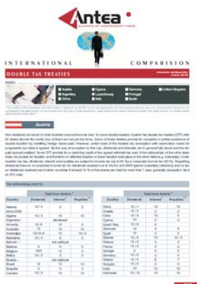
ANTEA Internacional Comparision Junio 2010