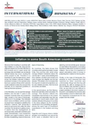
AUREN Internacional Business Junio 2010