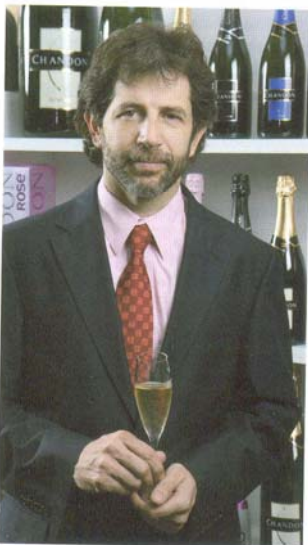
Mercado Mayo 2010