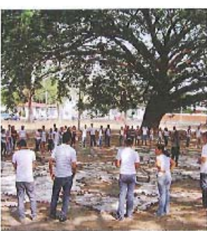
Algunos de la UNA participan de la intervención artística del parque de Liberia por la conservación del árbol de Guanacaste. SANDY RODRÍGUEZ

"Donde hay un árbol hay vida. Eso es lo que viene con. Siempre vamos de vida, con un árbol que es un árbol", dijo Clachar. La obra artística en el parque de Liberia, que se llama "Arte con mensaje", fue realizada por Clachar y un grupo de artistas de la UNA. La obra se realizó en el parque de Liberia, que se llama "Arte con mensaje".