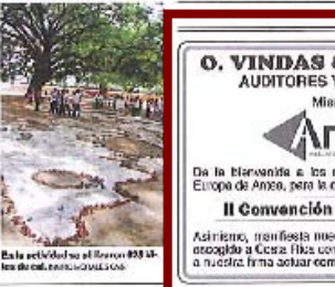
En la actividad se elige un árbol de Guanacaste. SANDY RODRÍGUEZ