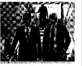
El auditor de Caja Guadalajara cuestiona la viabilidad de la entidad financiera, lo que podría afectar a su reestructuración por Cajaos.